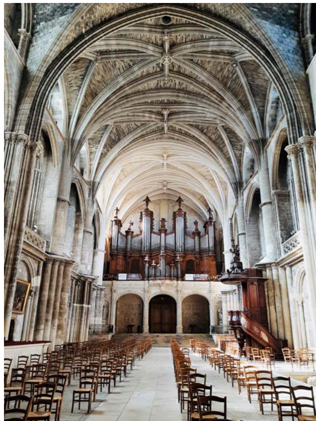
Cathédrale Saint-André de Bordeaux – Gironde

→ 2,1 millions d'euros du centre national de la musique (CNM) pour accompagner la filière musicale