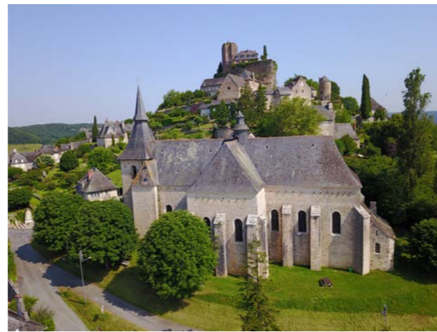
Église Saint-Paul – Corrèze